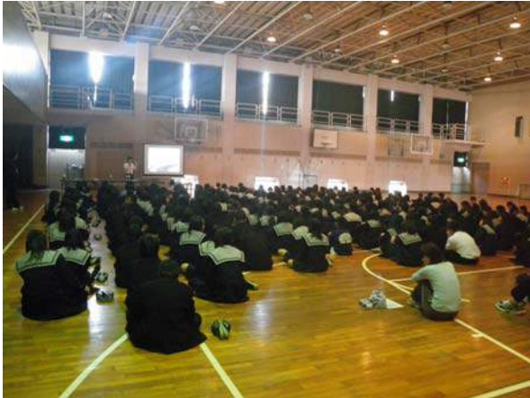
大和川の長さはどのくらいかな？

今回は大和川の概要、付替の歴史、そして水の汚れを検査するパックテストを体験してもらいました。