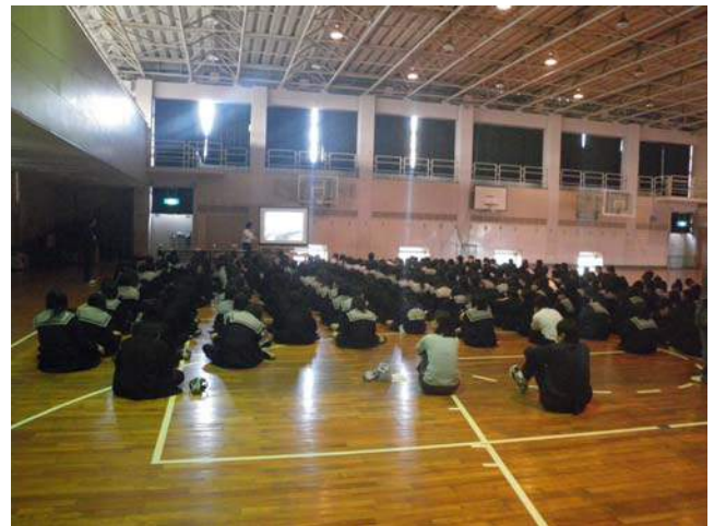
大和川の付替について