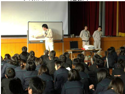
大和川について勉強中！