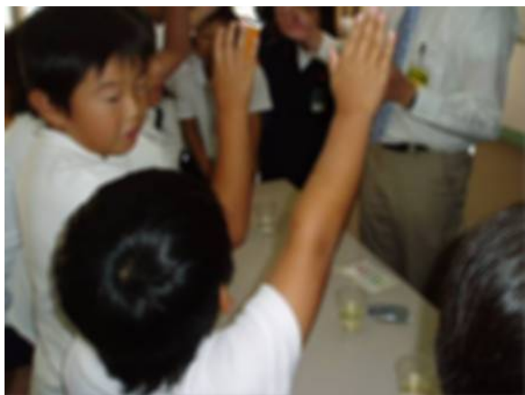
パックテストをやってみたい人～?! はーい!!