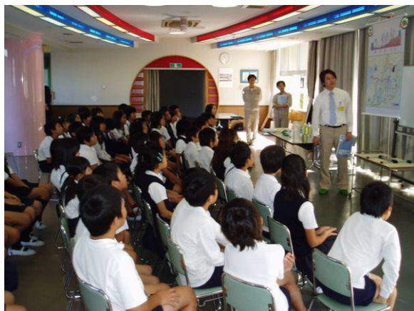
なるほど。大和川ってこんな川なんだね。

大和川の概要を説明した後、川が持っている不思議な力（＝自浄作用）について一緒に考えました。その後、4つのグループに分かれて、『大和川・今井戸川・小学校内の池の水・生活排水（水道水に醤油を数滴落とした水）』の4種類でパックテストを実際に体験してもらいました。