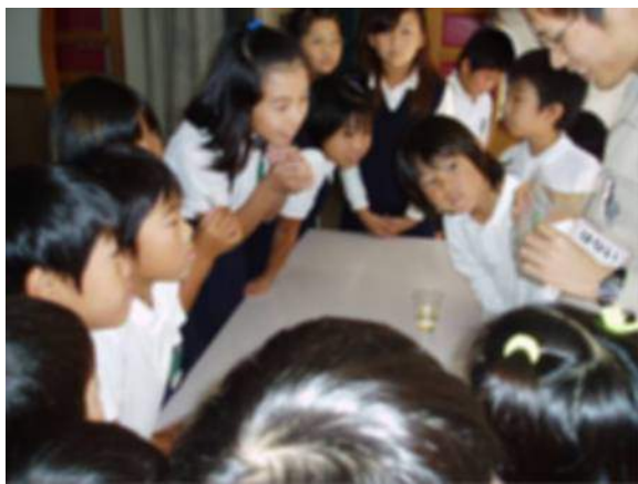
パックテスト。みんな真剣に取り組んでいます。