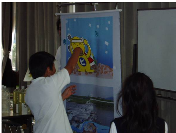
微生物は、有機物を食べてくれるけど、人間や魚と同じで生きていくのに酸素が必要なんだよ。