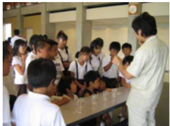
パックテスト。みんな目が真剣です。