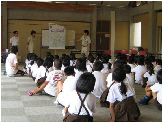
大和川ってこんな川なんだあ・・・。

大和川の概要を説明した後、昔の大和川の付け替えの歴史や現在の大和川の状況、また川が持っている不思議な力(=自浄作用)について一緒に考えました。 その後、3つのグループに分かれて、大和川・佐味田川(学校で用意してくれた水)・水道水・生活排水(水道水に醤油を一滴落とした水)の4種類でパックテストを行いました。