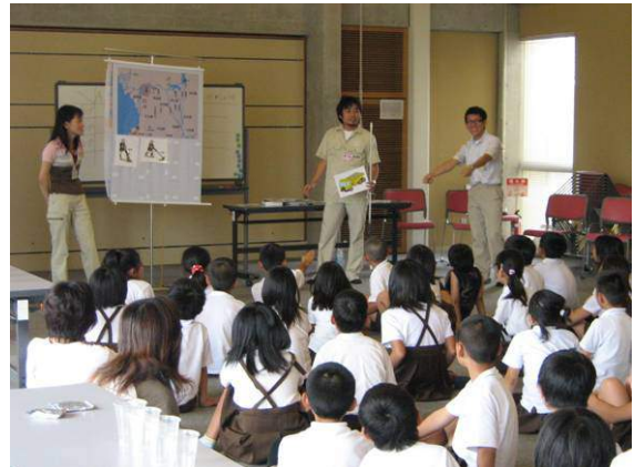
大和川の付け替え工事はなんと約8ヶ月！すごいね。