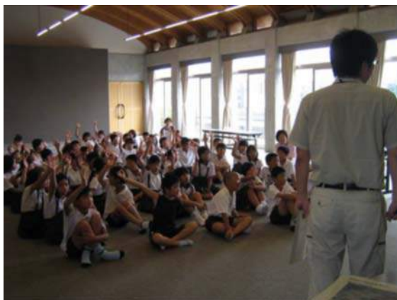
大和川で遊びたい人～？！ は～い！