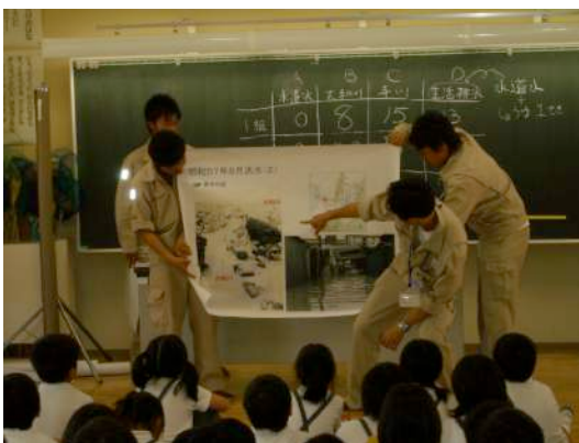
昔、大和川が氾濫し大きな被害が出たんだね。