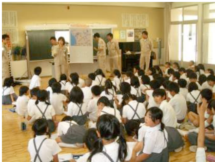
微生物の働きで、川は自らきれいになるんだね。

もうすぐ、社会の授業で下水処理場に見学に行くので今日の授業はとても勉強になったようです。