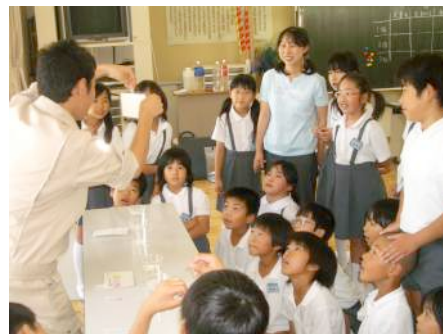
バックテストの様子。一番汚れている水はどれかな・・・?