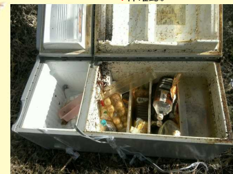
大和郡山市の佐保川の右岸左岸約1.6kmの間で4件確認。