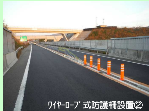
ワイヤー式防護柵設置②