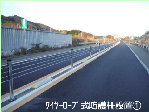
ワイヤー式防護柵設置①