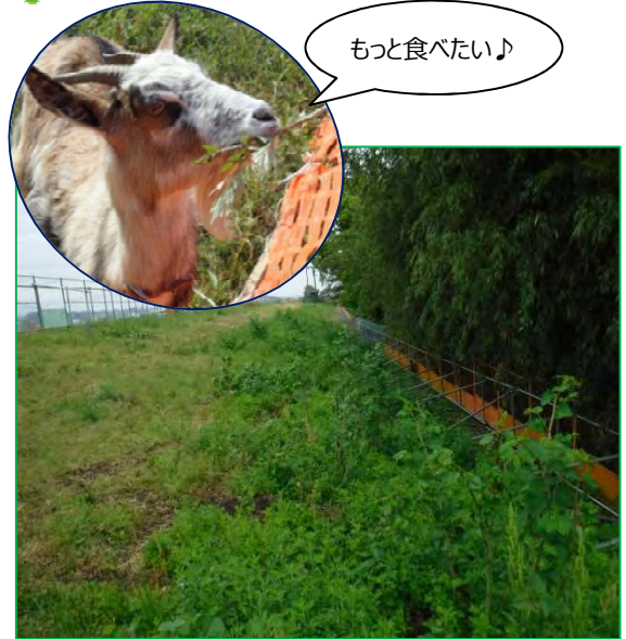
除草前 5月2日 仮囲い完了

5月2日の仮囲い完了時には一面に青々とした草が広がっていましたが、6月18日にはヤギたちの働きにより草が減りすっきりとしています。