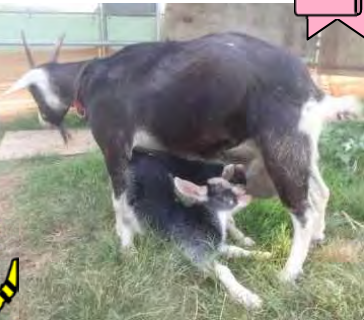
▲元気いっぱい授乳中!