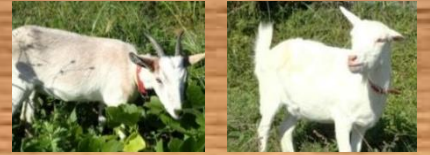
シンディー (♀) ポーズ (♀) トカラヤギ シバヤギ ベージュの毛色 角がなく坊主頭