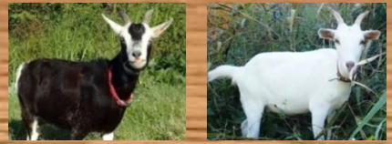
リーダー カゴ (♀) ウメ (♀) トカラヤギ シバヤギ 白黒の毛色 角があり白の毛色