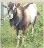
メイコフ ♂ トカラヤギ 唯一のオスで リーダー