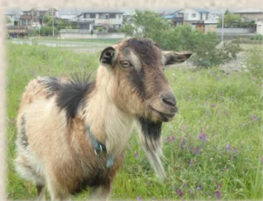
ミヨコ ♀ トカラヤギ 背筋が黒毛の 女の子