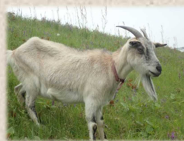
シンティー ♀ トカラヤギ 立派な角の 女の子