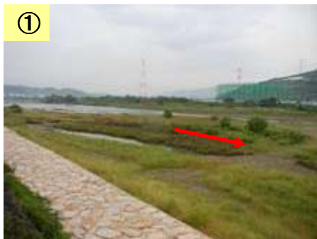
築堤工事が未実施

※農業振興地域及び農用地区域は、1/25,000スケールからの転記であり、地籍等は考慮していない。