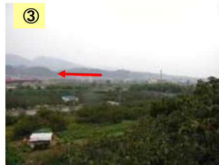
人家が点在している