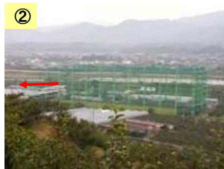
ゴルフ練習場が立地している