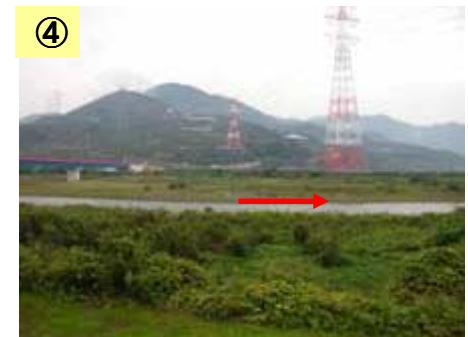
築堤工事が未実施