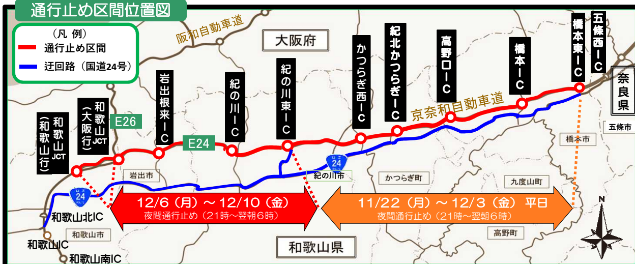
通行止め区間位置図

道路を利用する皆様にはご迷惑をおかけしますが、ご理解とご協力をお願いいたします。