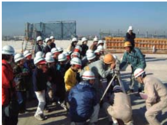
昨年の見学会の様子