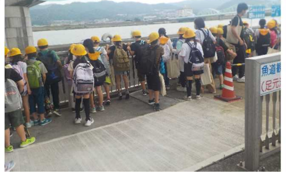
和歌山市立宮小学校4年生