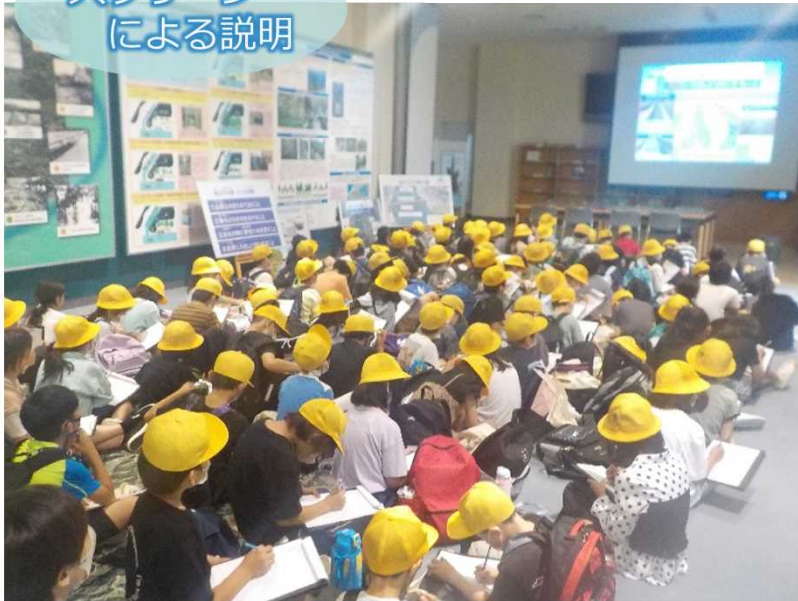
和歌山市立宮小学校4年生

紀の川大堰の役割について説明しました。皆さん、メモを取りながら説明を聞いてくれました。