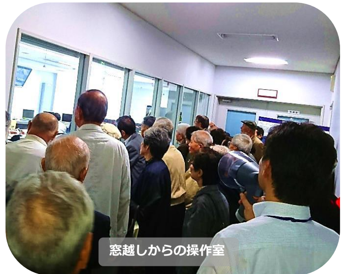
窓越しからの操作室

雨のため、予定していた展望デッキでの記念撮影はできませんでしたが、3F屋内から紀の川や大堰周辺を見ながら、紀の川大堰についての説明を行いました。また、皆さんから「大堰のゲートを上げる時間はどれぐらいかかるのか」、「どこからゲートを上げる操作をしているのか」、「紀の川の水位はどこで測っているのか」など、たくさんの質問もいただきました。