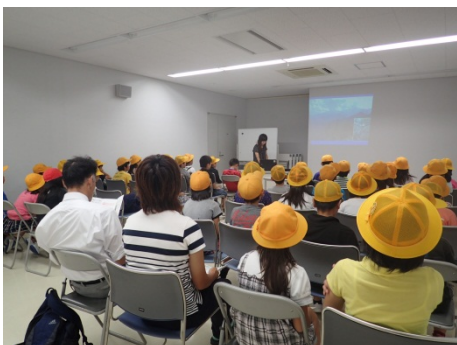
熱心に説明を聞く様子