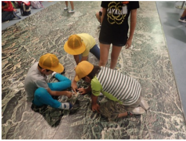
大台ヶ原は、どの辺にあるのかなあ