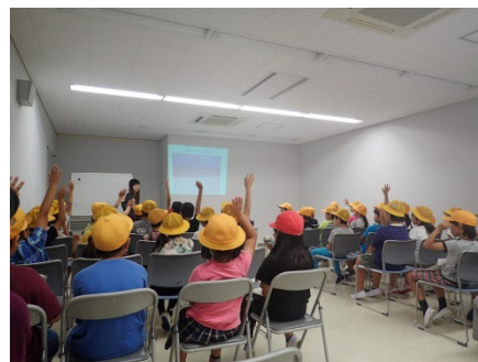
積極的に質問に答える様子