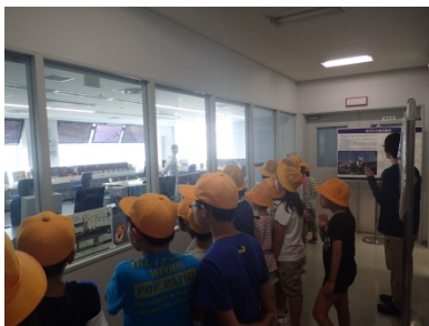
2F操作室に展示しているアユの卵に興味を示している様子