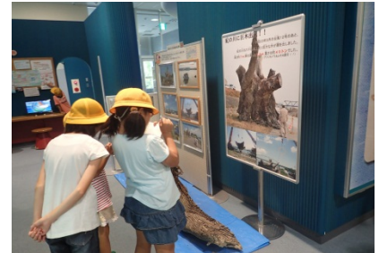
こんなに巨大な木が紀の川に流れてきたんだなあ