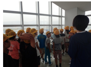
3F展望デッキから、紀の川大堰を見ている様子 雨なので残念