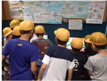
パソコンクイズに夢中になっている様子