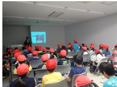
問題に答えている様子