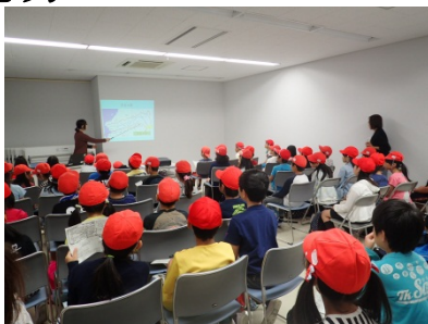
熱心に説明を聞く様子