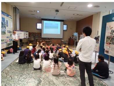
積極的に手を挙げている様子