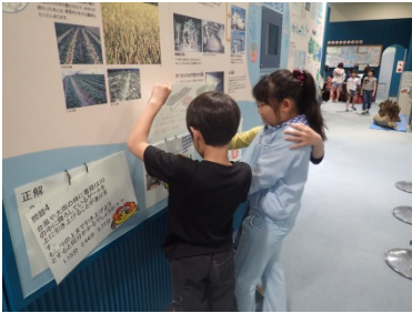
1Fのきらめきクイズに挑戦している様子