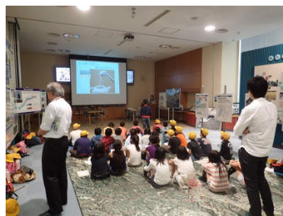
問題に答えている様子