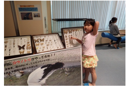
紀の川周辺に生息する生き物を観察している様子