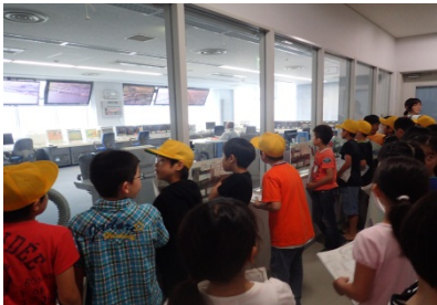
2F操作室の大きさに圧倒している