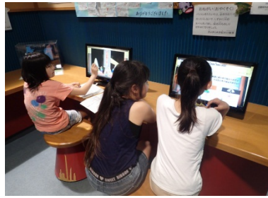
パソコンクイズに夢中になっている様子