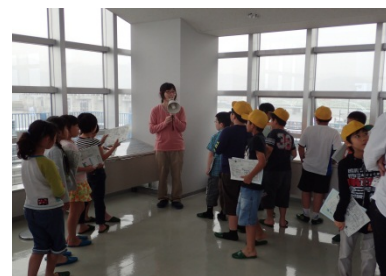
3F展望デッキから、紀の川大堰を見ている様子