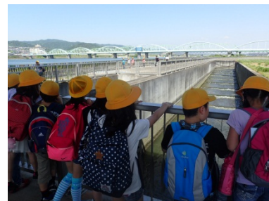
階段式魚道を上から見てみる