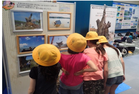
1F館内巨大流木写真を見入る様子