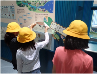
1Fの館内クイズに挑戦している様子