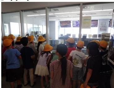
2F操作室の大きさに圧倒している様子