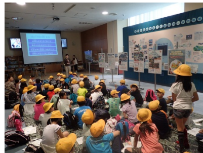
質問している様子