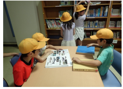
1F館内に置いている本を熱心に読んでいる様子