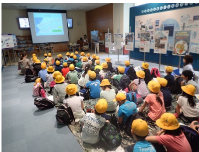
熱心に説明を聞いている 様子