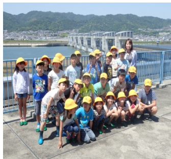
3F展望デッキで記念撮影