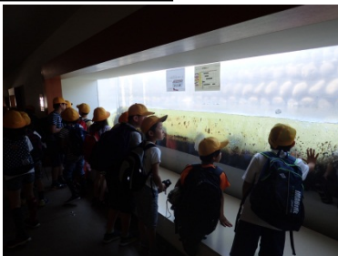
魚道観察室から階段式魚道の状況を観察