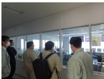
2F操作室にて堰の監視の様子を見学している