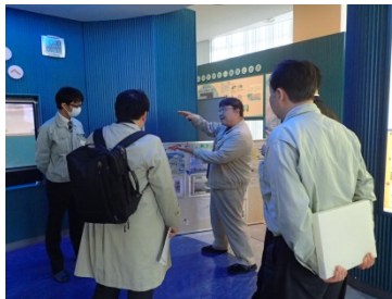
1Fの説明を熱心に聞いている様子