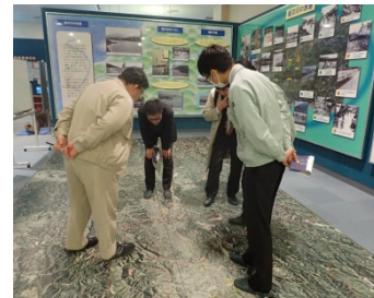
航空写真で、位置を確認している様子