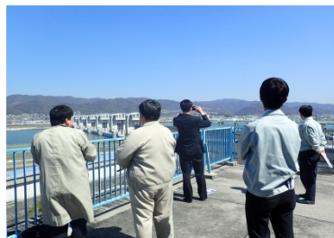
3F展望台から、紀の川大堰を眺めている様子