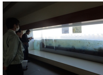
魚道観察室から階段式魚道の状況を観察 今の時期はアユの稚魚がたくさんいるなあ！！