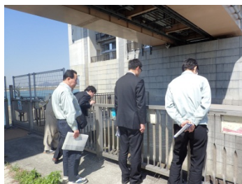
階段式魚道を上から見てみる