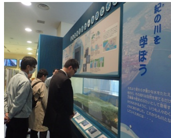
立体模型で見ると分かりやすいなあ