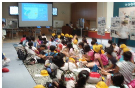
説明を聞いている様子

紀の川の概要、紀の川大堰の目的、紀の川大堰についてスライドを用いて吉川非常勤職員が説明