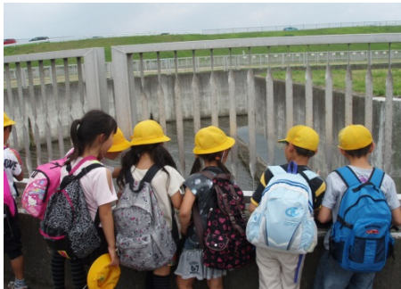
人工河川式魚道を上から見てみる 白い網は、鳥が魚を捕って食べないようにするためという説明を聞いている様子