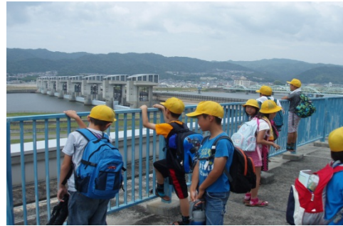
3F展望デッキから、自分達の学校を探している様子