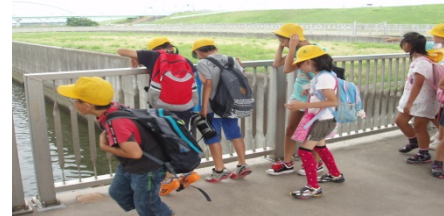
魚道観察室から階段式魚道の状況を観察