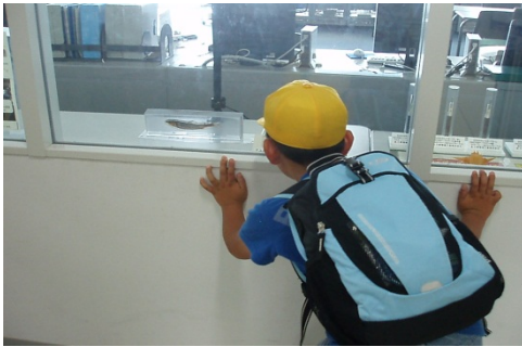
2F操作室に展示しているアユの卵に興味を示している様子