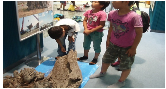
1F館内展示物見学 (巨大流木引き上げ) 平成24年8月3日に紀の川大堰上流で引き上げられた幹回り12mの巨大流木写真を見入る、実際に手で触っている様子