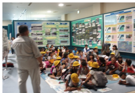
元気よく質問している様子