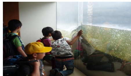
魚道観察室から階段式魚道の状況を観察