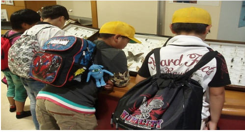
1Fにて昆虫の標本に熱心に見入る様子