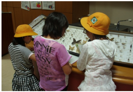
1Fにて昆虫の標本に見入る様子