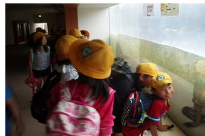
魚道観察室から階段式魚道の状況を観察魚を見つけて喜んでいる様子