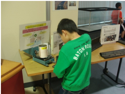
1Fにてプーリー滑車や水密ゴムに見入る様子