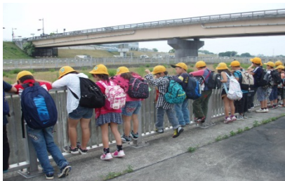
階段式魚道を上から見てみる