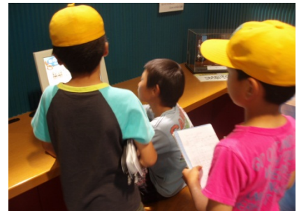
1Fにてパソコンのクイズに正解し喜んでいる様子