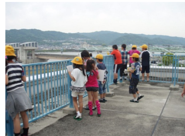
3F展望デッキから、紀の川大堰を見ている様子