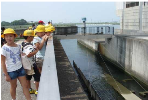
階段式魚道を上から見ている様子