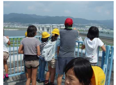
3F展望台から紀の川大堰を勉強する様子