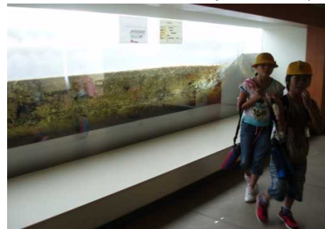
階段式魚道を横から見ている様子