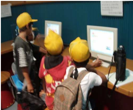
皆でパソコンのクイズにチャレンジ!!何問正解するかな!?