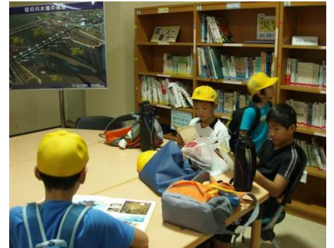
きらめき館内の本を熱心に読んでいる様子