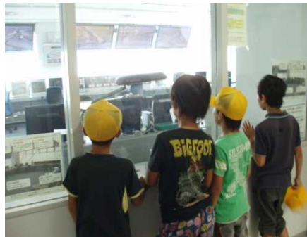
2F操作室を見て圧倒している様子