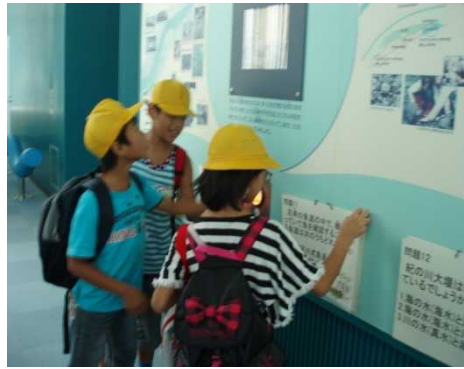
きらめきクイズに挑戦している様子