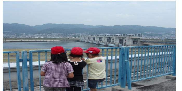
3F展望デッキから、紀の川大堰を見ている様子

3.館内展示を見学後、きらめき館から徒歩約3分の魚道観察室へ移動 階段式魚道、デニールボックス付バーチカルスロット式魚道、人工河川式魚道を上から見て、それぞれの特徴を学んだ後、階段式魚道の横に設置された魚道観察室を見学。