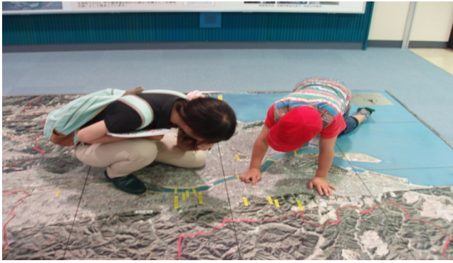
1Fの紀の川流域航空写真で自分達の学校がどこにあるか先生と一緒に探している様子