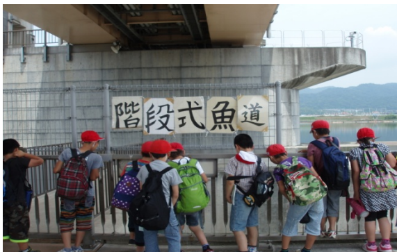
階段式魚道を上から見てみる

3.館内展示を見学後、きらめき館から徒歩約3分の魚道観察室へ移動 階段式魚道、デニールボックス付バーチカルスロット式魚道、人工河川式魚道を上から見て、それぞれの特徴を学んだ後、階段式魚道の横に設置された魚道観察室を見学。