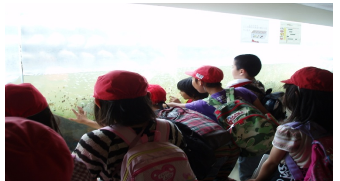
魚道観察室から階段式魚道の状況を観察