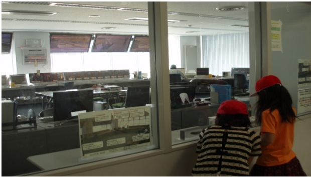
2F操作室に展示しているアユの卵に興味を示している様子