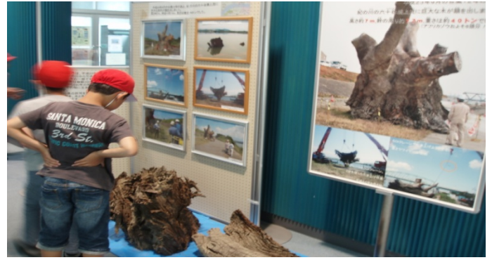
1F館内展示物見学(巨大流木引き上げ)平成24年8月3日に紀の川大堰上流で引き上げられた幹回り12mの巨大流木写真を見入る