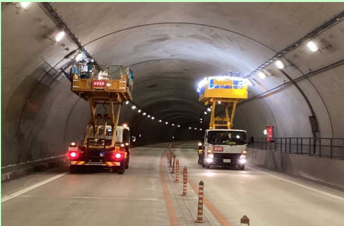
トンネル照明設備の更新

安全に走行していただくために トンネル照明設備の更新や路面補修等の工事を行います。