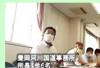
豊岡河川国道事務所 所長 他6名