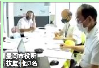
豊岡市役所 技監 他3名