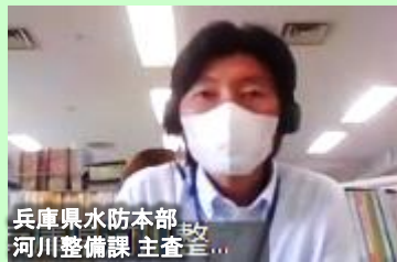
兵庫県水防本部 河川整備課 主査