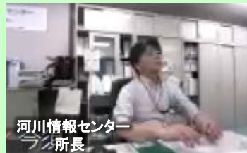
河川情報センター プラン所長