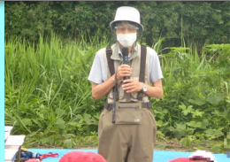
先生より川に入る前に気をつけることを確認しました。