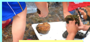
水生生物は石の裏に隠れています。