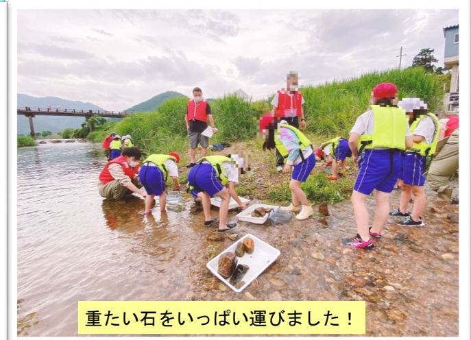
重たい石をいっぱい運びました！