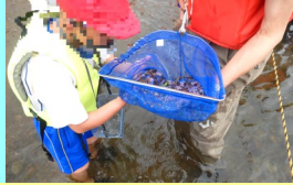
捕まえた生き物が何か教えてもらっています！