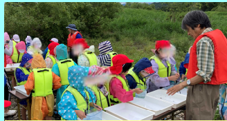
捕まえた生き物が何か教えてもらっています！