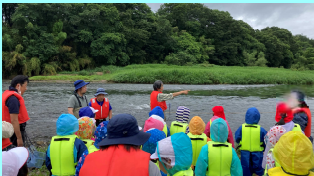
まずはライフジャケットの正しい付け方を聞きました。