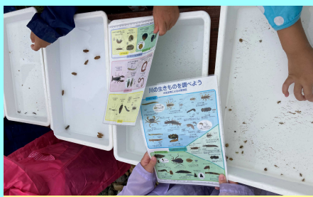
採取した水生生物をトレイに入れ種類の分別をしました。