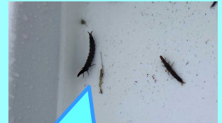
カワゲラが採れたよ！