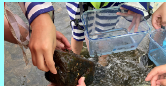
水生生物は石の裏に隠れています。