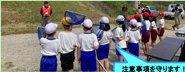
注意事項を守ります！