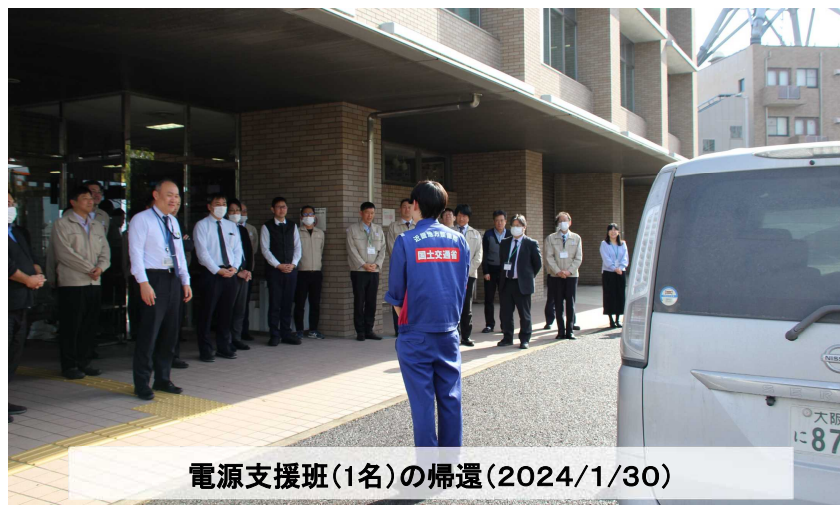
電源支援班(1名)の帰還(2024/1/30)