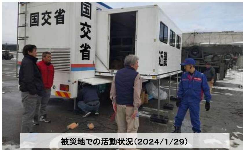
被災地での活動状況(2024/1/29)