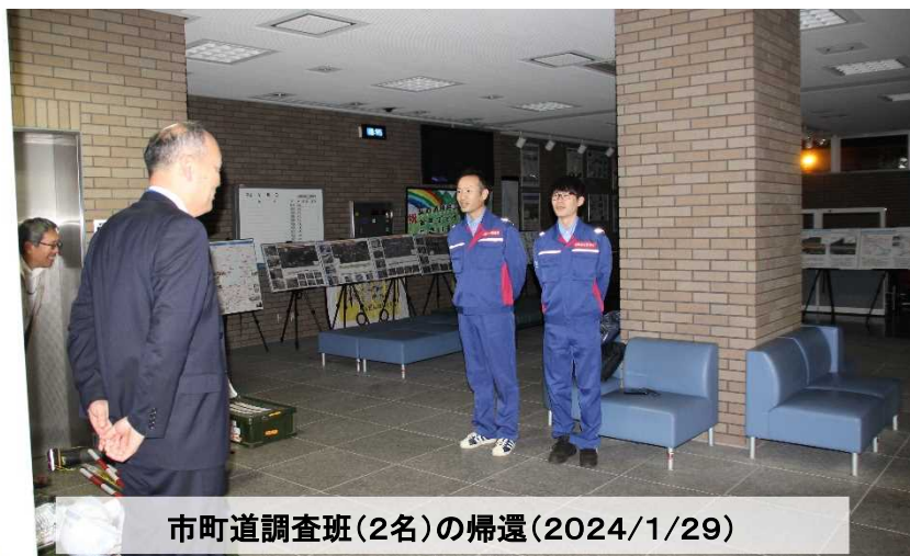
市町道調査班(2名)の帰還(2024/1/29)