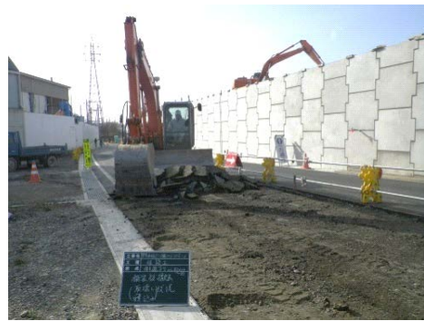
▲栗東水口道路六地藏地区本線側道整備工事 施工者:(株)桑原組