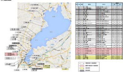
▲国道161号穴太高架橋他橋梁補修設計業務 施工者：(株)橋梁コンサルタント 関西支社