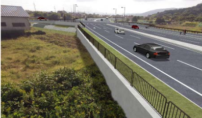
▲湖北バイパス海津・西浜地区道路詳細設計業務 施工者：三井共同建設コンサルタント(株) 関西支社