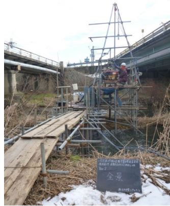
▲一般国道8号賤ヶ岳橋架替地質調査業務 施工者：(株)田中地質コンサルタント