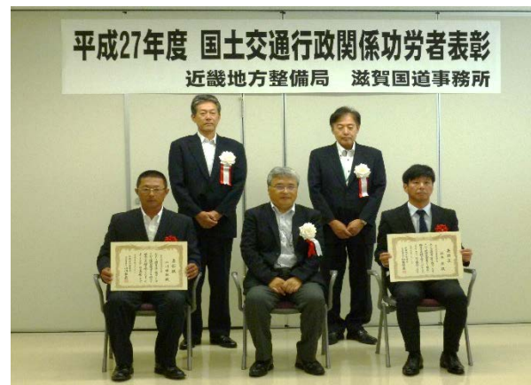
▲表彰状を授与された優秀建設技術者の皆様