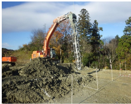
▲栗東水口道路小野地区他改良工事 施工者:(株)桑原組