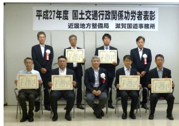
▲表彰状を授与された優秀建設技術者の皆様