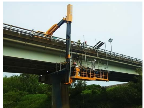
▲国道8号馬渡橋耐震補強その他工事 施工者:ショーボンド建設(株) 京都支店