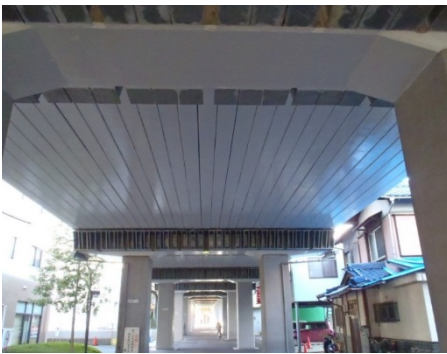
▲国道1号石山高架橋橋梁補修工事 施工者:(株)IHIインフラ建設 関西支店