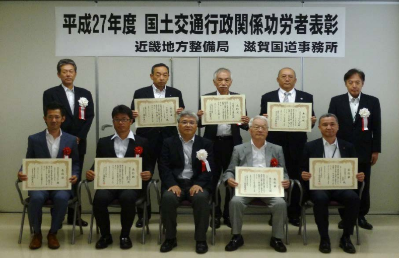
▲表彰状を授与された、建設コンサルタントの皆様