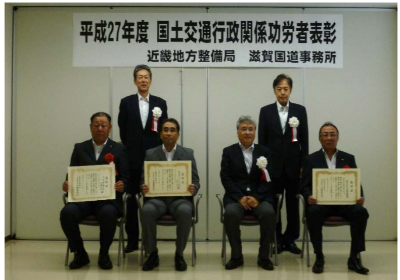
▲表彰状を授与された、優良工事等施工業者の皆様