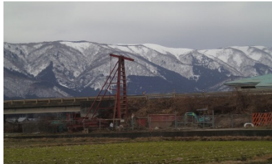
▲高島地区水源地調査業務 施工者：(株)建設技術研究所 大阪本社