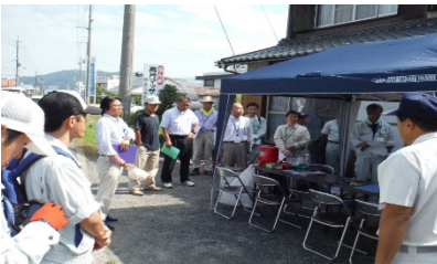
▲高月地区自歩道設置事業2工区他用地測量等業務 施工者：(株)ユース