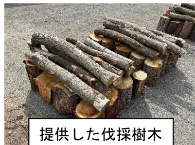
提供した伐採樹木