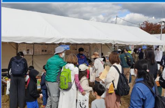
建設機械・災害対策用機械ペーパークラフト