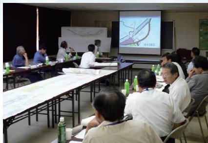
パートナー協議会（マキノ土に学が里センター）

行政と住民が対等の立場で、望ましい道路構造を実現するため、共存共栄の精神（パートナーシップ）で道路整備を進めます。