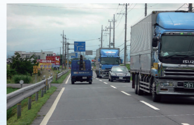
湖北バイパス4工区(現況)