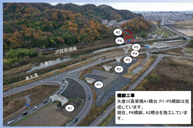
橋脚工事 矢倉川高架橋A1橋台、P1-P5橋脚は完成しています。現在、P6橋脚、A2橋台を施工しています。