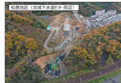
松原地区 (流域下水道センター周辺)