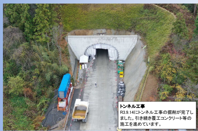
トンネル工事 R3.9.14にトンネル工事の掘削が完了しました。引き続き覆工コンクリート等の施工を進めています。