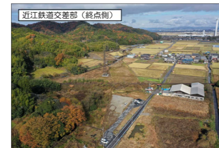
近江鉄道交差部 (終点側)