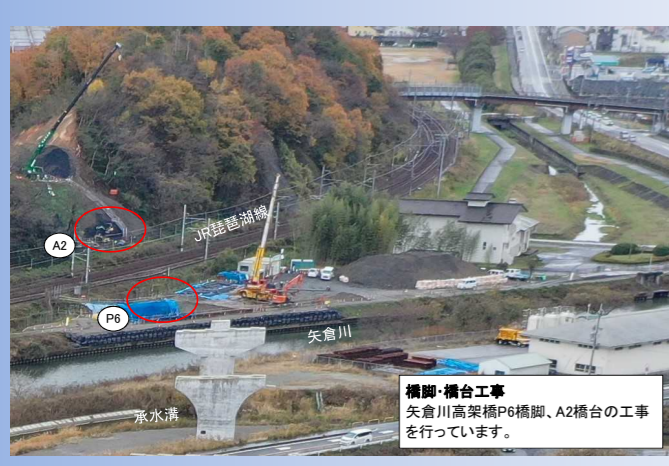
橋脚・橋台工事 矢倉川高架橋P6橋脚、A2橋台の工事を行っています。