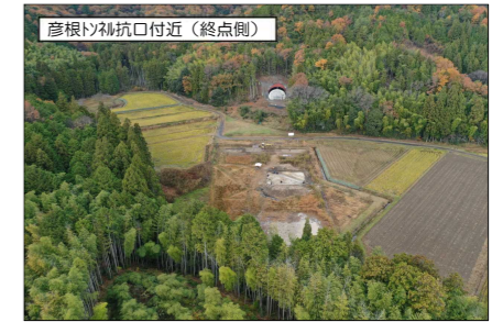
彦根トンネル坑口付近 (終点側)