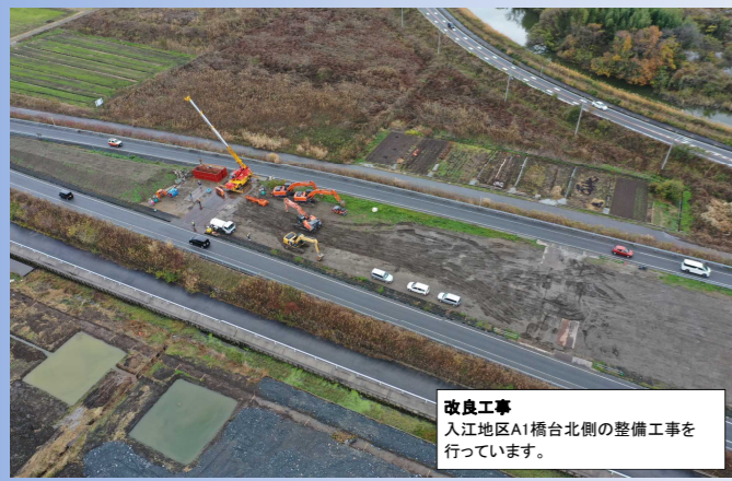
改良工事 入江地区A1橋台北側の整備工事を行っています。