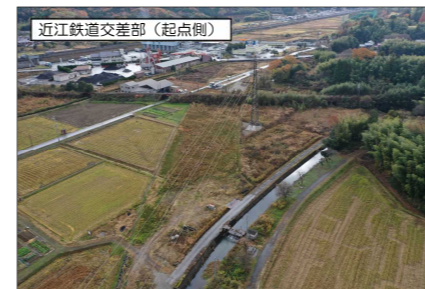
近江鉄道交差部 (起点側)