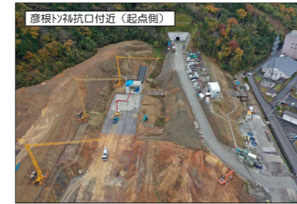
彦根トンネル坑口付近 (起点側)