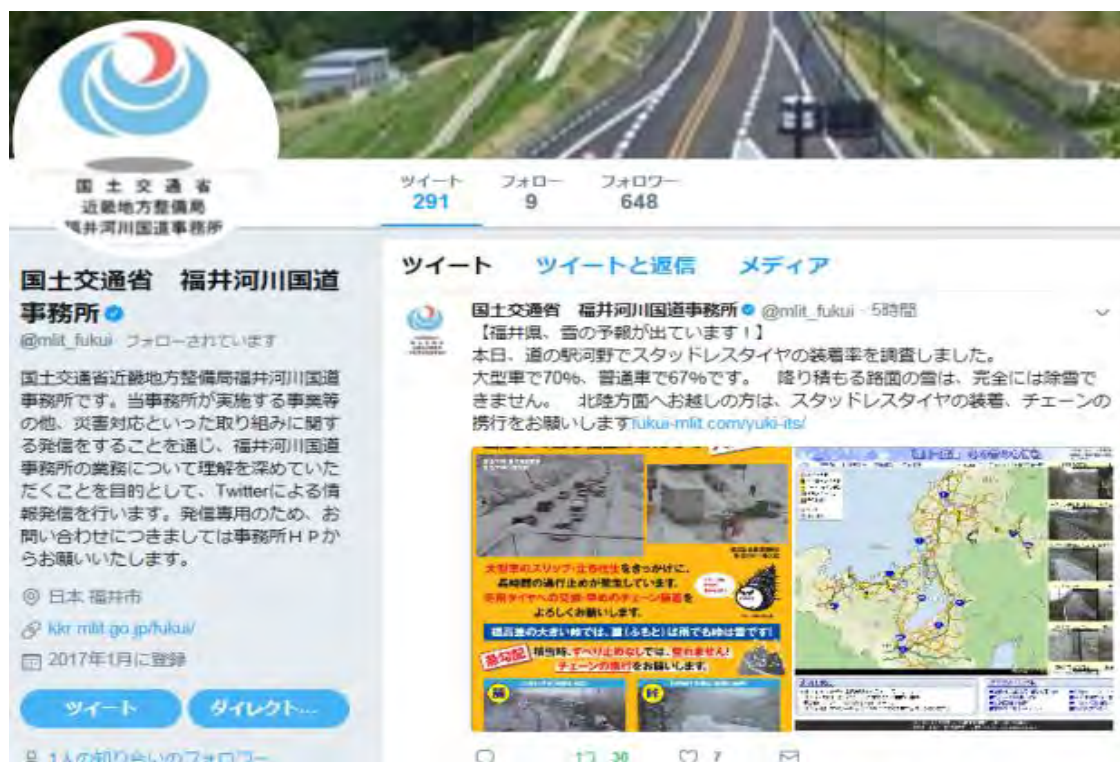
※福井河川国道事務所におけるツイート