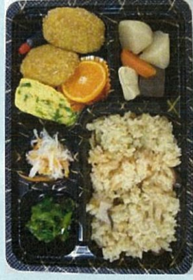
道の駅弁当「かなん冬の恵み」

「かなん」(大阪府河南町)道の駅と大阪府立大学の大学生のコロナによりオリジナル弁当を開発