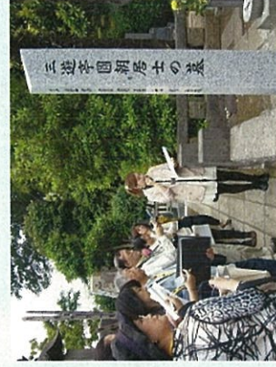
地域巡りガイドの様子