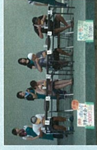
大学生が企画したイベント