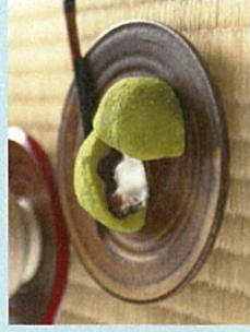
地元産菓子「霧の森大福」