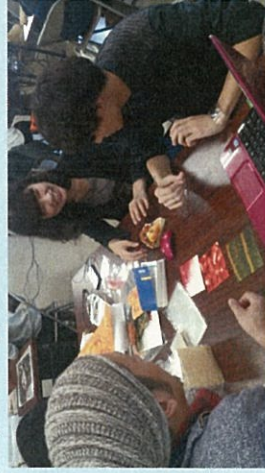
包装デザイン打合せ

京都府亀岡市、南丹市、京丹波町の道の駅 ・京都精華大学の大学生が、道の駅で販売するスイーツパッケージジをデザイン