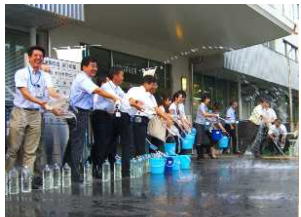
平成25年度の実施状況(大阪合同庁舎1号館前 H25.7.24)