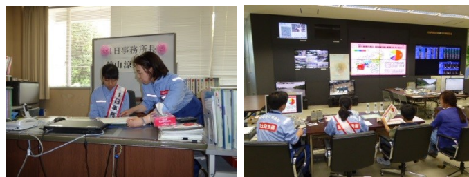
【デスクワーク&amp;ミーティング】