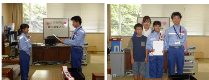
【一日事務所長任命式】

一日事務所長には、デスクワークや災害対策ミーティング、台風5号の影響で約700 m 3 /sの放流が行われていた天ヶ瀬ダムの施設点検などを体験していただきました。