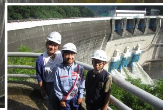
右岸堤頂から点検