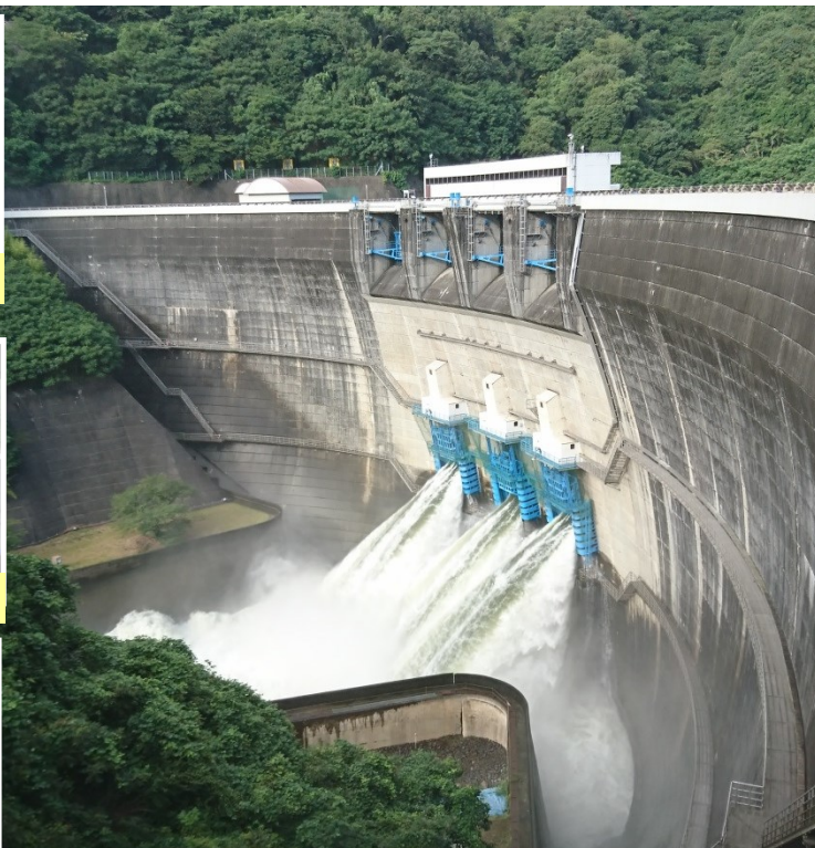
【天ヶ瀬ダムの施設点検】