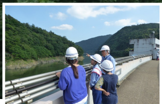
ダム貯水池の点検