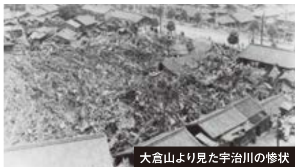
大倉山より見た宇治川の惨状