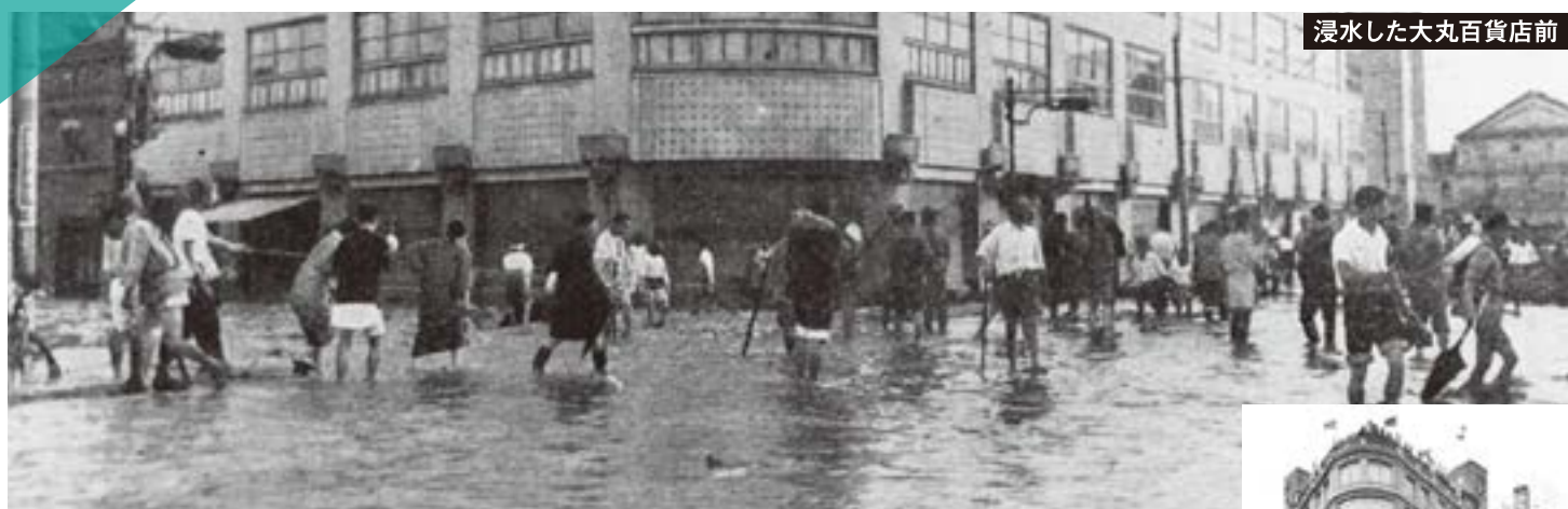
浸水した大丸百貨店前