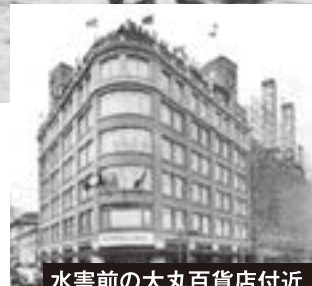
水害前の大丸百貨店付近