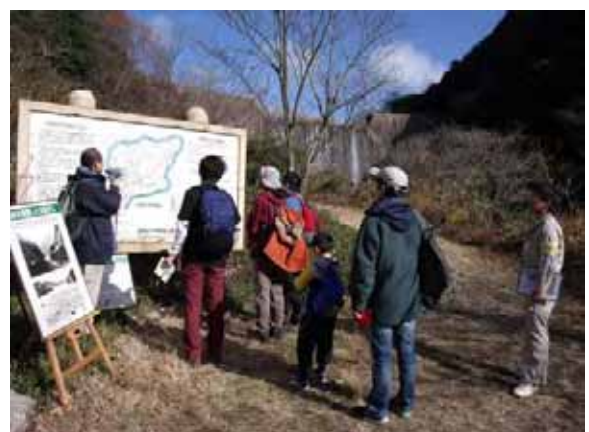
住吉川の災害の歴史の説明