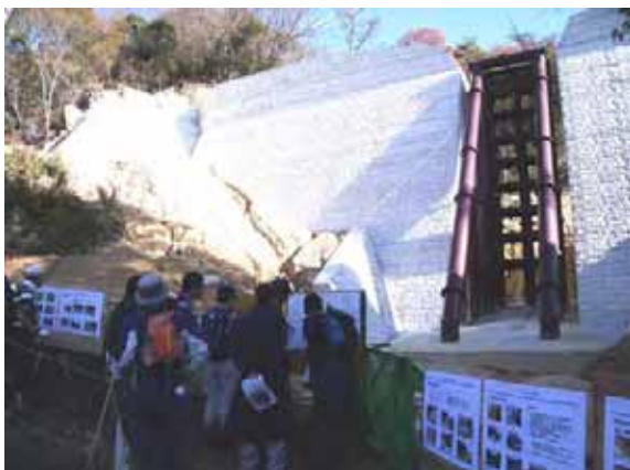
えん堤工事現場の見学と説明