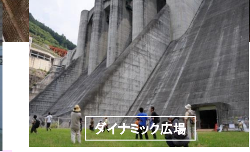
ダイナミック広場

大滝ダムでは、8月5日に「大滝ダム体験ツアー」を開催します。今回のイベントでは、ダムの役割や洪水の恐ろしさなどを身をもって体験していただけるよう、普段は入れないゲート室やダイナミック広場と、大滝ダム・学べる防災ステーションの豪雨体験をご案内致します。