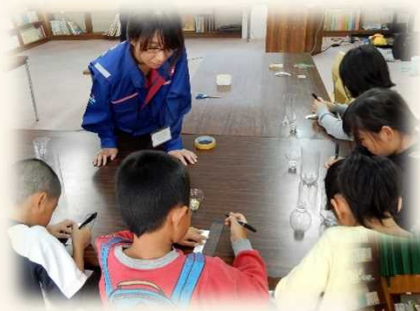
ペットボトル雨量計や新聞紙スリッパの作成