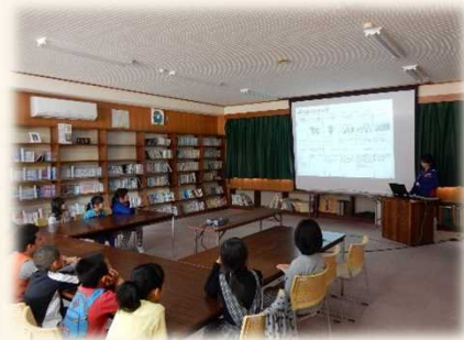
防災に関する紙芝居