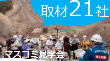
マスクゴミ見学会