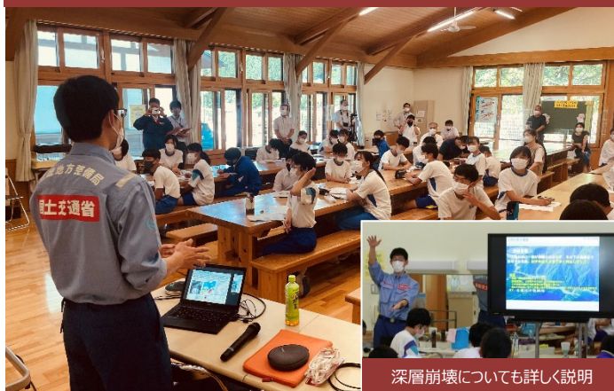
深層崩壊についても詳しく説明