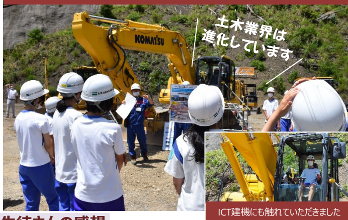
ICT建機にも触れていただきました