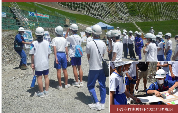
土砂崩れ実験キットで勉強も説明