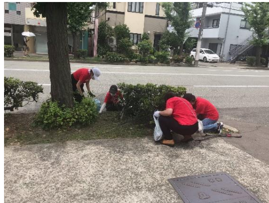
写真:国道2号 清掃活動