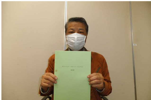
10月21日兵庫国道事務所にて協定受理