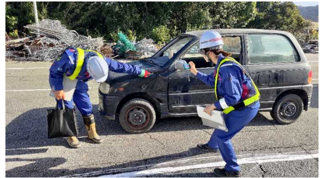
▲車両移動前の状態写真撮影の様子