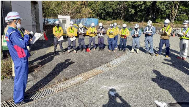
▲災対法による車両移動についての概要説明