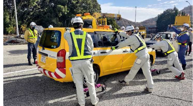
▲ゴージャッキでの車両移動の様子