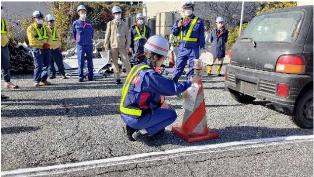
▲車両移動後の提示の様子