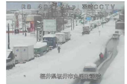
②(2/7 15時頃)4車線区間の滞留状況