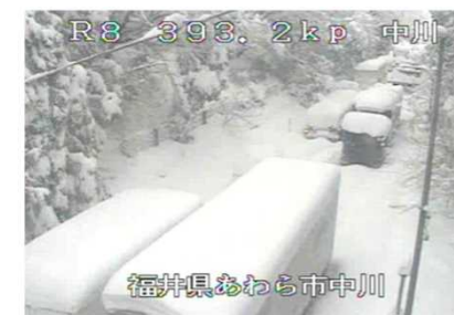
①(2/7 10時頃)2車線区間の滞留状況

○福井県嶺北地方では、平成30年2月4日から7日にかけての降雪が、6日16時までの24時間で平地でも60cmを超える記録的な大雪となった。また、あわら市から坂井市において9箇所で立ち往生車両が発生した。その影響で、約1,500台の大規模な車両滞留が発生し、約66時間の通行止めが発生した。